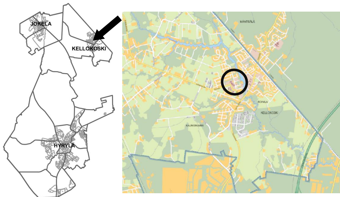
Sijaintikartta ja opaskarttaote