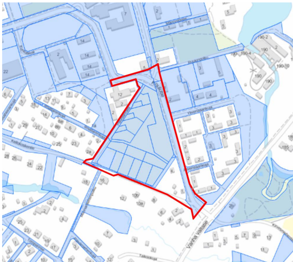
Pohjakarttaote ja maanomistusalueet, sinisellä merkityt alueet kunnan omistuksessa