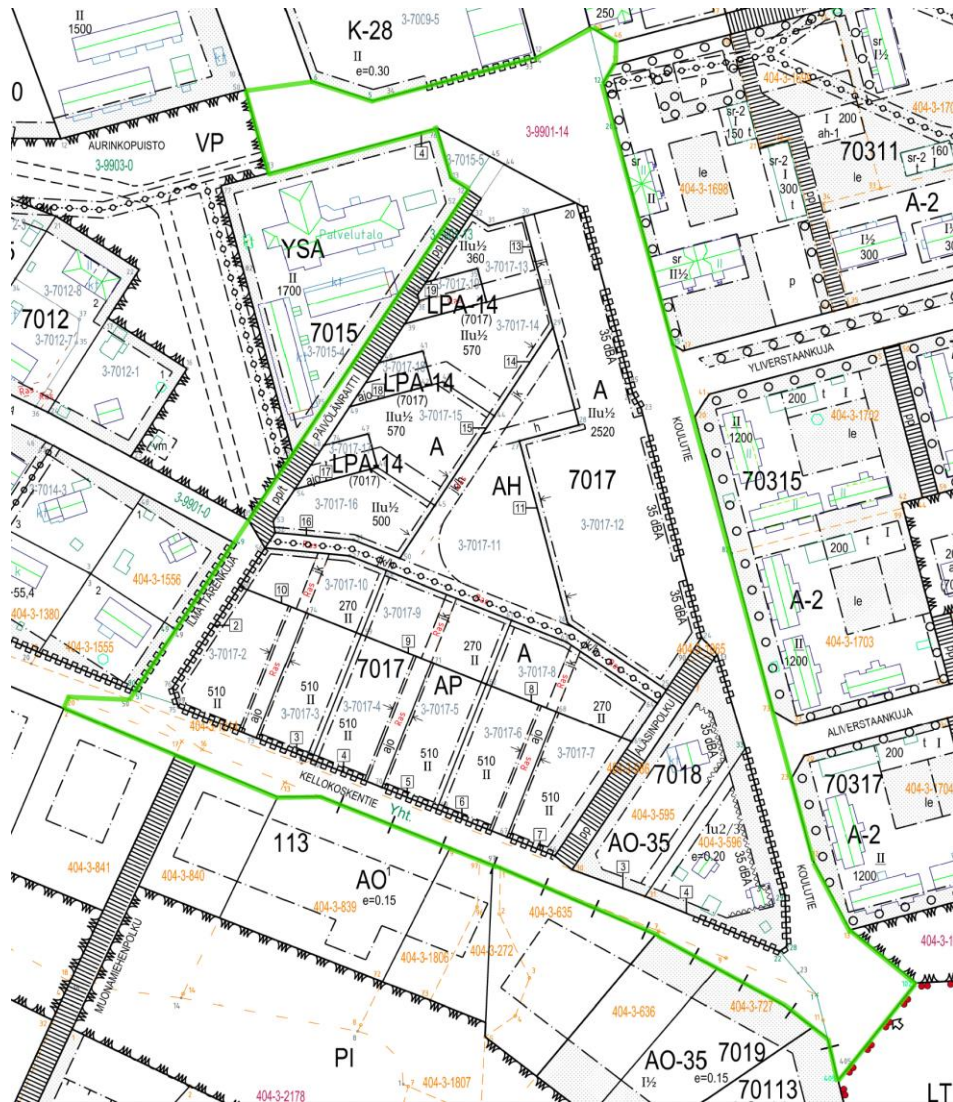
Ote ajantasa-asetuksesta (20.2.2023), kaava-alueen rajaus vihreällä

Alueella on voimassa Keskustakolmio III -asemakaava (kaavanro 3401, voimaantulo 18.5.2006) sekä Koulutien asemakaava (kaavanro 3513, voimaantulo 3.12.2014). Alue on osoitettu asumiseen.