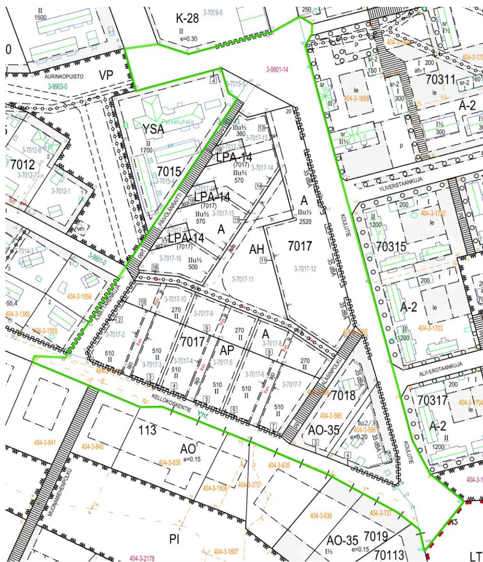
Asemakaavan muutosrajaus ajantasakaavaotteella